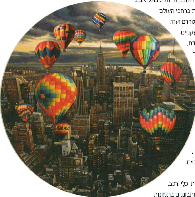
"Hot Air Balloons" (2016)

כשמתבוננים בתמונות "טיפות הגשם", קשה לא להיזכר בילדות, בימים שבהם ישבנו במושב האחורי של המכונית, כשבחוץ ירד גשם וכל צבעי הנוף היטשטשו דרך השמשות הרטובות