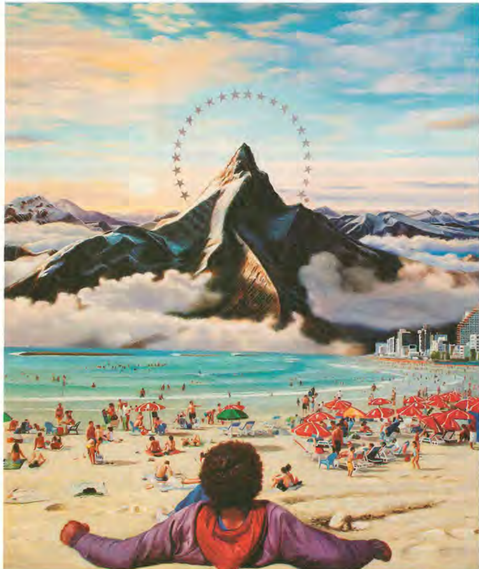
כמה רחוק, 2010, שמן על בד. מסלול עוקף קטסטרופה

וכך, בתשובה הצלולה הזאת, הגיעה רכבת המסע שלי בחיפושי אחרי שי קון לרציף בטוח, גם אם ארעי. זו לבטח לא התחנה האחרונה. זה לא הסוף. הכל בהיר עכשיו, הכל נכון. נותרה לי רק עוד שאלה אחת למאסטר הציור הזה, לקלאסיקן הפוסט־מודרניזם שי קון. לסיכום, אמא שלך ביקשה ממני לשאול אותך דהוף מה עם נבדים ממך ומאשתך? “תודה על ההתקלה. אתה יכול למסור לה בשמי שזו שאלה שאני שואל את עצמי כל הזמן. אבל אני מרגיש סופסוף שמח ושלם, וכל הקרדיט הוא לאשתי. אני לבטח לא מרגיש צורך לראות את המשכיות הביולוגית שלי בעולם. זו פשוט אחריית שהיא לא לכוחי. אני מנשים חיים לתוך העבודה שלי כל יום, וזה קשה ומתגמל מספיק. אגב, תבקש מאמא שלי שתוסיף עוד מלח לקצי- צות בפעם הבאה.”