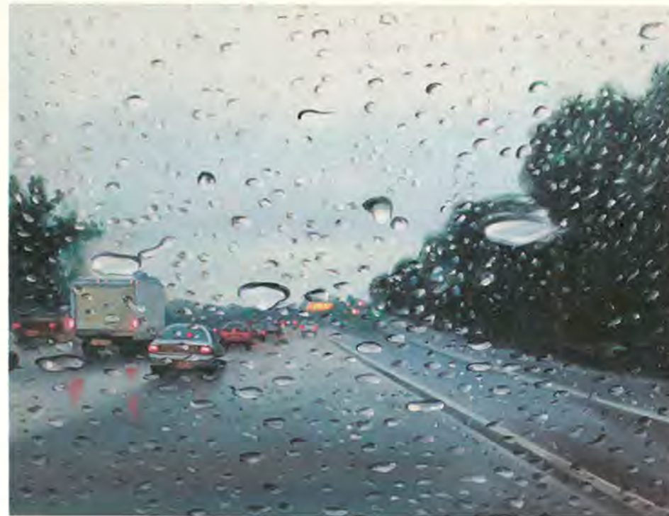
כמה רחוק, 2010, שמן על בד. מסלול עוקף קטסטרופה

ובישראל אתה נהנה להיות? “לא. איך שאני מגיע אני מיד רוצה לחזור לניו יורק.”